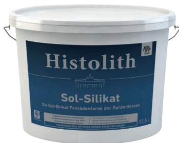
Histolith® Sol-Silikat Peinture sol-silicate premium

Tous les produits Histolith® au silicate contiennent uniquement des pigments inorganiques, y compris le best-seller Histolith® Sol-Silikat. Ce dernier est une peinture de façade minérale, dotée d'une combinaison de solvants inédite, qui unit les avantages des peintures à base de silicate et de résine de silicone. Ainsi, elle est parfaite pour les supports minéraux et la remise à neuf de vieilles peintures mates à dispersion et à base de résine de silicone. L'ajout de verre soluble au lithium empêche en outre les efflorescences de carbonate de potassium et produit des couleurs particulièrement éclatantes, à la stabilité optimale.